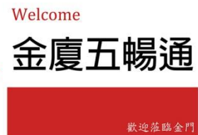
金廈五暢通接機牌