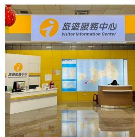
水頭碼頭旅客服務中心