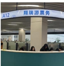
五通碼頭A12票務櫃檯