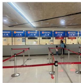
金門水頭碼頭船務櫃台